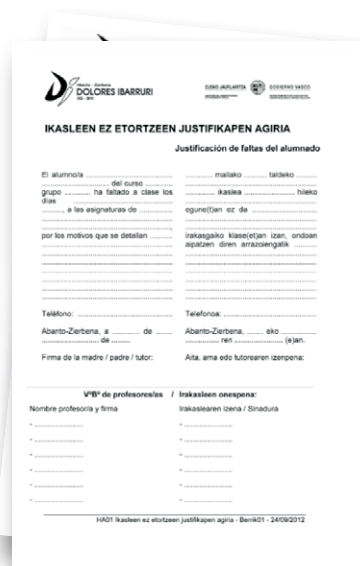
JUSTIFICACIÓN DE FALTAS DEL ALUMNADO