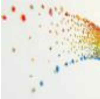
Arte plastikoak eta diseinua