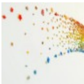
Arte plastikoak eta diseinua