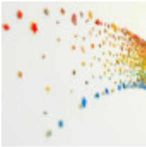
Arte plastikoak eta diseinua